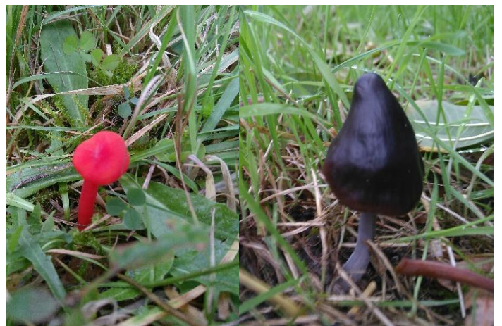
Zeldzame paddenstoelen.