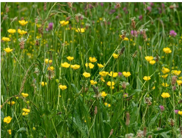
Bloemrijk grasland.