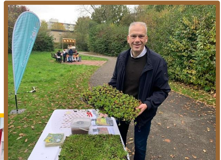
06-11: Actiedag Groene Daken in Couwenhoven Tientallen bewoners laten zich inspireren