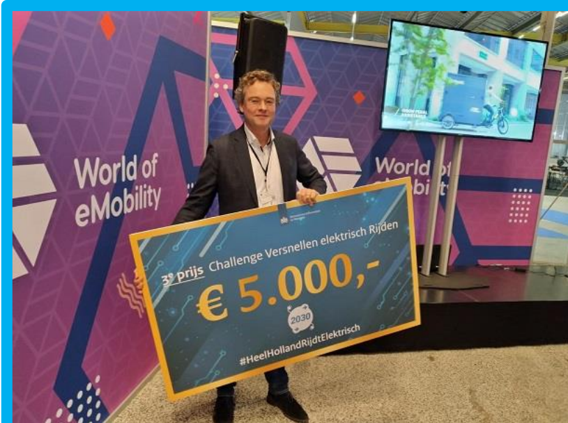
22-11: Samen Slim Rijden Zeist wint 3e prijs In challenge 'Elektrisch rijden versnellen' van ministerie van I&W