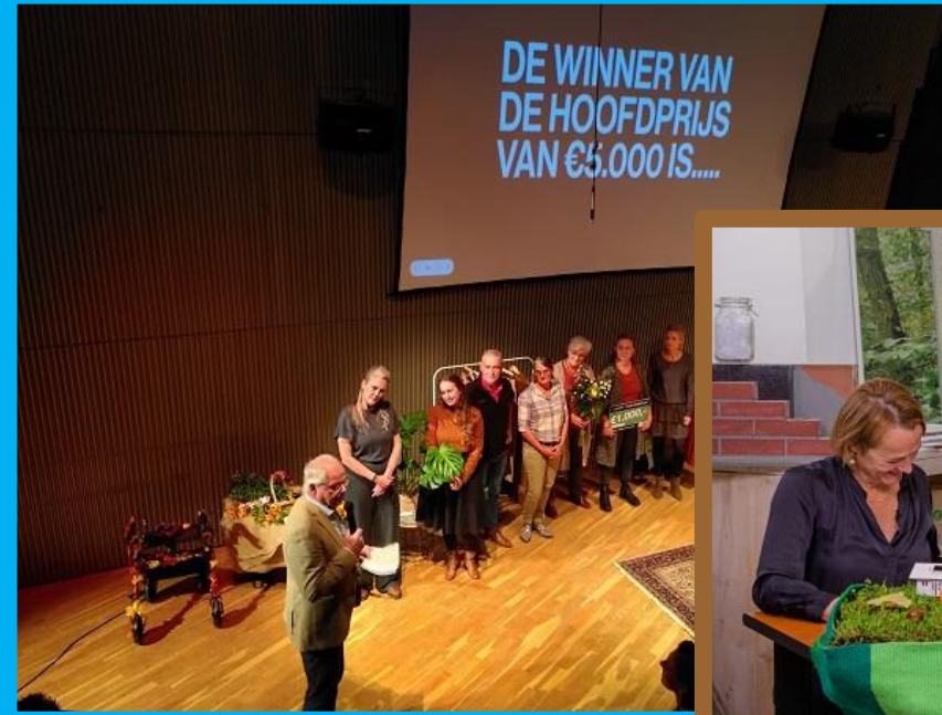
14-10: Finale 5K-pitch Met Uit de Kluiten als grote winnaar