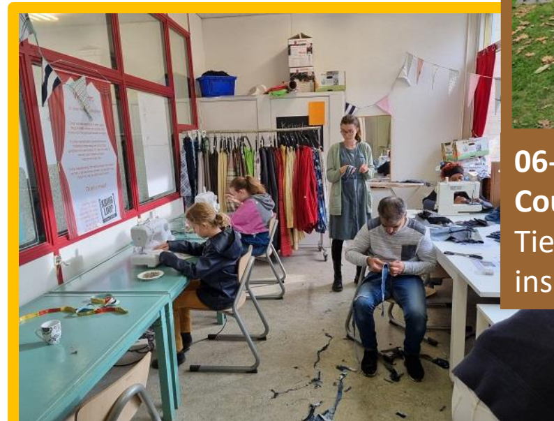
22-11: Kringloop Zeist start textielopleiding voor jongeren onder de titel 'Launch your Future'