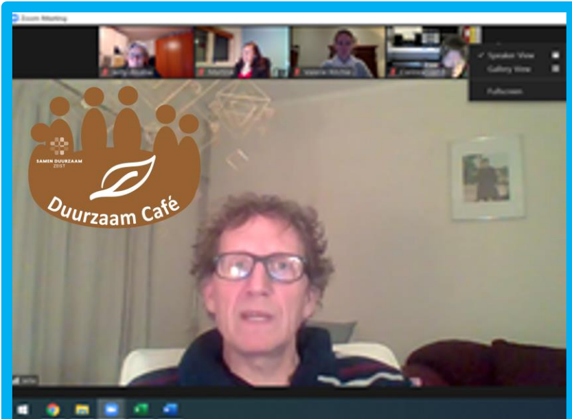
17-02: Eerste Duurzame Café van SDZ Met als thema consuminderen

24-02: Bewoners onderzoeken kansen voor een Duurzaam Griffensteyn Enquête onder meer dan 300 inwoners