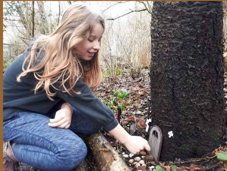
11-02: Kabouters gespot in de Boswerf Activiteit voor kinderen in de voorjaarsvakantie