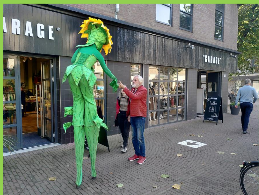
09/16-10: 2e Week van de Duurzaamheid 28 verschillende activiteiten in Zeist en Den Dolder