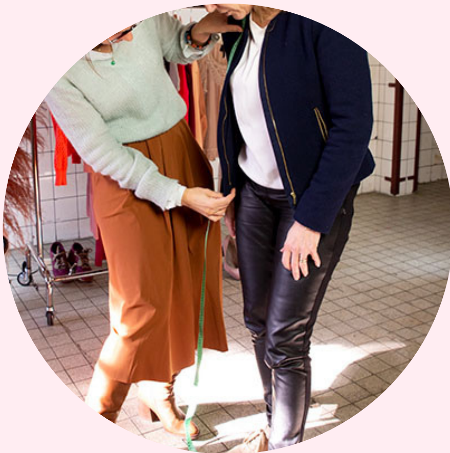
1 op 1 advies