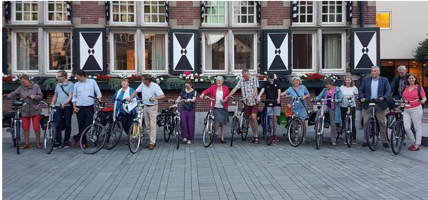
17 juni 2019 Kick off Zeist 15 van de 20 snuffelfietsen